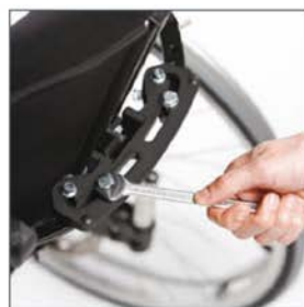
Anpassung über V-Trak Original oder V-Lite Halterung