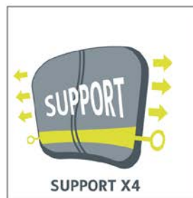
Profilanpassung mit 4 verstellbaren Bändern